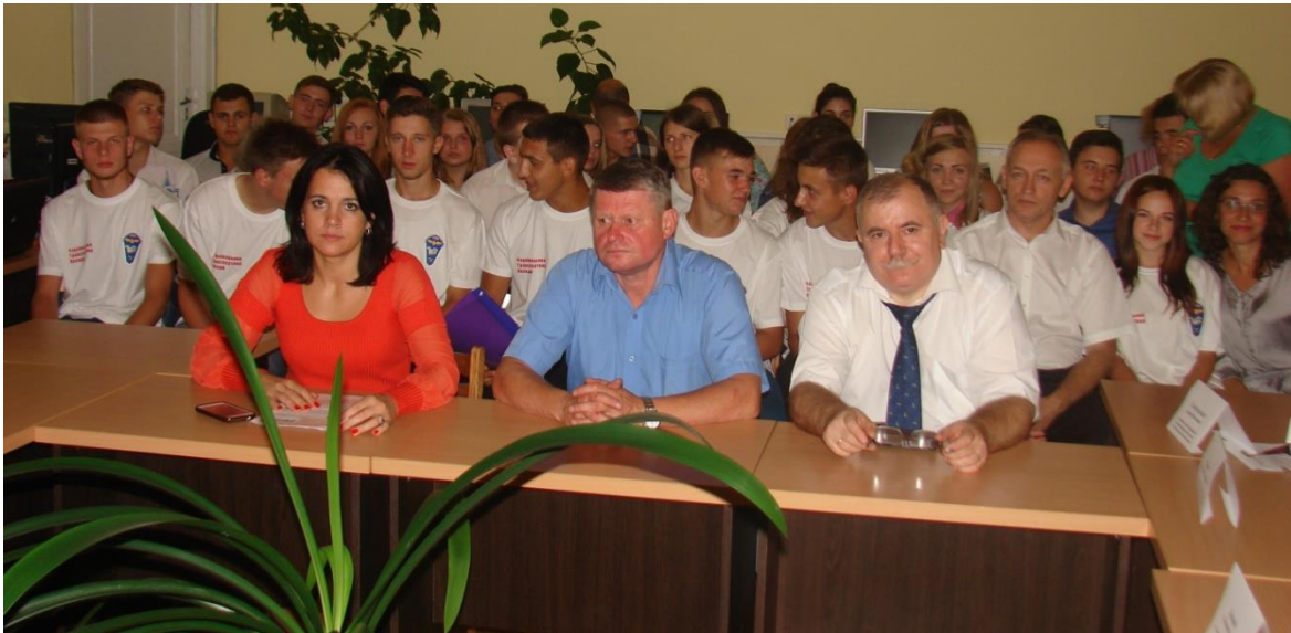
Серед присутніх були ветерани буковинської залізниці, викладачі та студенти Чернівецького транспортного коледжу.